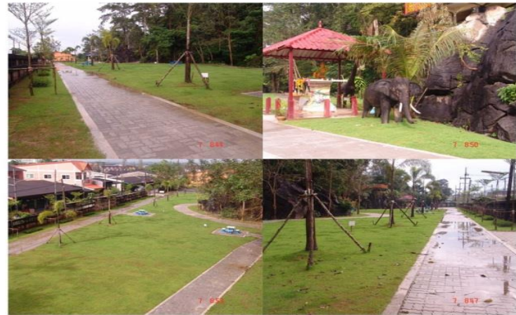
เทศบาลตำบลชะมาย