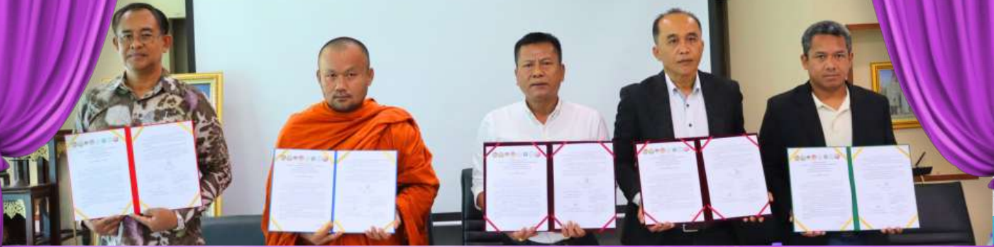
การขับเคลื่อนตำบลเข้มแข็ง ตามหลักปรัชญาเศรษฐกิจพอเพียง ประจำปีงบประมาณ พ.ศ.2569

ในวันที่ 26 มีนาคม 2569 เวลา 13.00 - 14.30 น.