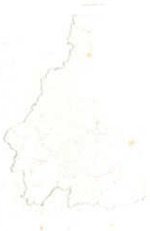
แผนผังแสดงโครงการคมนาคมและขนส่ง