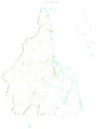
แผนผังแสดงที่ตั้ง

จึงขอเชิญชวนประชาชนไปตรวจดูแผนที่แสดงเขตท้องที่ที่จะวางและจัดทำผังเมืองรวม แผนผังแสดงการใช้ประโยชน์ที่ดินในอนาคต แผนผังแสดงที่ตั้ง แผนผังแสดงโครงการคมนาคมและขนส่ง แผนผังแสดงโครงการกิจการสาธารณูปโภค แผนผังแสดงโครงการกิจการสาธารณูปโภคเพื่อการระบายน้ำ ข้อกำหนดการใช้ประโยชน์ที่ดินพร้อมรายการประกอบผัง และบัญชีแนบท้าย ข้อกำหนดของผังเมืองรวม และเข้าร่วมประชุมเพื่อเสนอความคิดเห็น ความต้องการ และข้อมูลต่างๆ ในการวางและจัดทำผังเมืองรวมจังหวัดนครศรีธรรมราช (ปรับปรุงครั้งที่ ๓) ทั้งนี้ เมื่อได้มีการประชุมรับฟังข้อคิดเห็นของประชาชนดังกล่าวแล้ว ผู้มีส่วนได้เสียสามารถยื่นคำร้อง แสดงความเห็นเกี่ยวกับ ข้อกำหนดการใช้ประโยชน์ที่ดินพร้อมสงวนสิทธิ์ดังกล่าว เป็นหนังสือภายในระยะเวลา และสถานที่ตามที่กำหนดไว้ในประกาศกรมโยธาธิการและผังเมือง มิฉะนั้น จะไม่สามารถใช้สิทธิในการยื่นคำร้องดังกล่าวได้ในภายหลัง