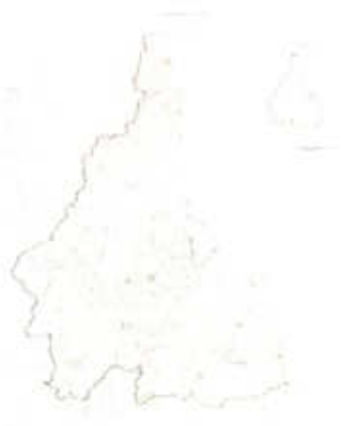
แผนที่แสดงเขตท้องที่ที่จะวางและจัดทำผังเมืองรวม