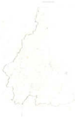
แผนผังแสดงโครงการกิจการสาธารณูปโภค