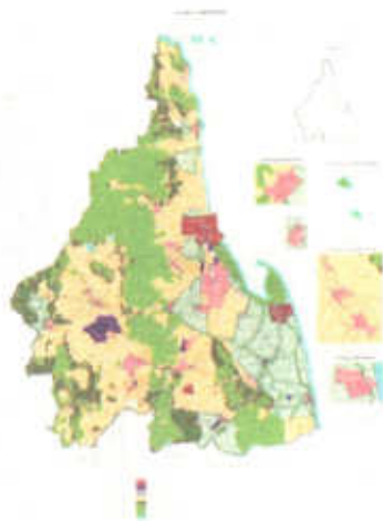
แผนที่แสดงการใช้ประโยชน์ที่ดินในอนาคต