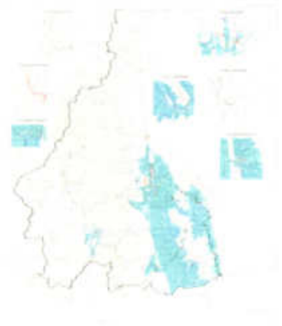
แผนผังแสดงโครงการกิจการสาธารณูปโภคเพื่อการระบายน้ำ